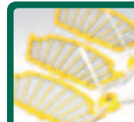
Ščetka - filter 3 kom

Na voljo je široka paleta pribora in rezervnih delov iRobot, ki vam bodo pomagali pri vzdrževanju vaše Roombe.