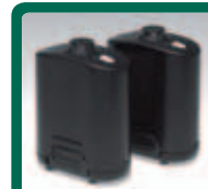
Kompaktna navidezna stena